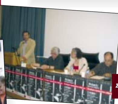
Στην εκδήλωση του ΣΥΡΙΖΑ για το σωφρονιστικό σύστημα

«... Αγωνιζόμαστε ενάντια στον εθνικισμό, το ρατσισμό, για την κοινωνική ένταξη των μεταναστών και των κοινωνικά αποκλεισμένων ... »