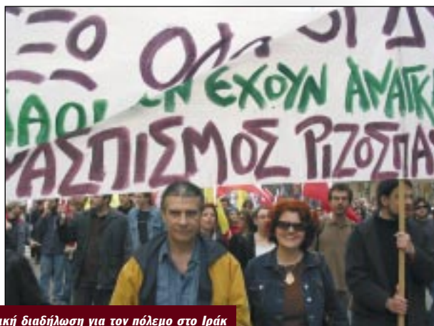
Αντιπολεμική διαδήλωση για τον πόλεμο στο Ιράκ

«Υπάρχει μια κληρονομική νόσος η οποία δεν εξαρτάται από τα γονίδια: Η φτώχεια...».