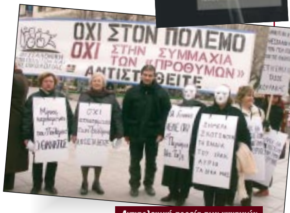
Αντιπολεμική πορεία των γυναικών της Δημοτικής Κίνησης, 2004