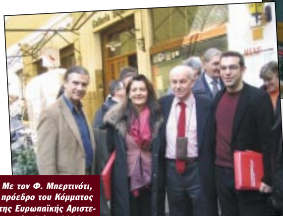
Με τον Φ. Μπερτινόνι, πρόεδρο του Κόμματος της Ευρωπαϊκής Αριστεράς, Ρώμη 2006