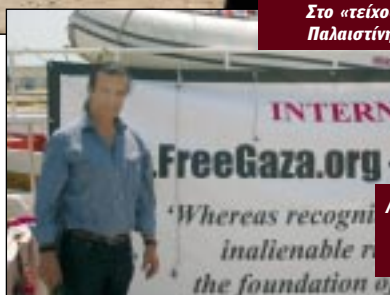
Λίγο πριν την αναχώρηση για τη Γάζα, Αύγουστος 2008