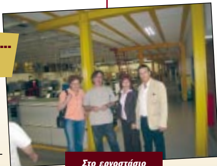
Στο εργοστάσιο SIEMENS