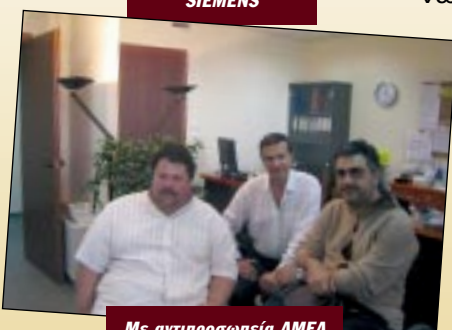
Με αντιπροσωπεία ΑΜΕΑ