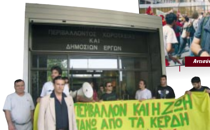
Συμβολική κατάληψη ΥΠΕΧΩΔΕ, 2008

«... Το ενωτικό μας εγχείρημα οφείλει να διαχωριστεί από τον κυβερνητισμό και την «κεντροαριστερά», αλλά και από τον μικρομεγαλισμό και τις αυταπάτες περί αυτόνομης οικοδόμησης του επαναστατικού μας προτάγματος. ...»