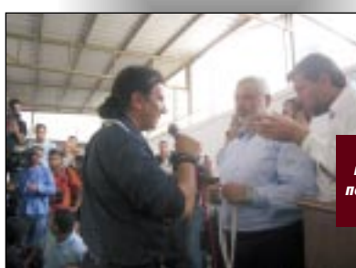
Βράβευση από τον παλαιστίνιο πρωτοπυργό Λανίγε, Γάζα, 2008