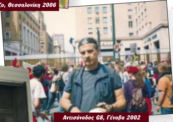
Αντισύννοδος G8, Γένοβα 2002

«... Τα κόμματα του δικομματισμού εδώ και χρόνια κατεδαφίζουν το κοινωνικό κράτος, περιστελλούν τις πολιτικές και ατομικές ελευθερίες, απορρυθμίζουν τις εργασιακές σχέσεις, ιδιωτικοποιούν τα δημόσια αγαθά της παιδείας, της υγείας, τους δημόσιους οργανισμούς. ... »