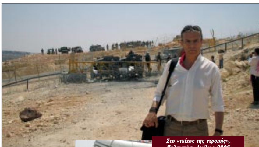
Στο «τείχος της ντροπής», Παλαιστίνη, Ιούλιος 2006